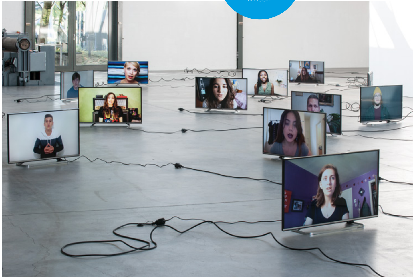
Anahita Razmi Werkstattpreisträgerin 2015 Blick in die Ausstellung »Tutti«, 2015 Videoinstallation, Werkstatthalle